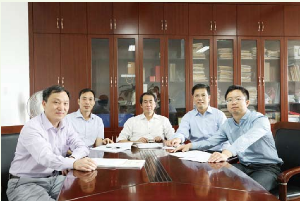
8月17日，国家自然科学基金创新研究群体项目揭晓，南京农业大学作物疫霉菌的致病机理与病害调控团队，作为江苏仅有的2支高校团队之一，获得了该项目支持