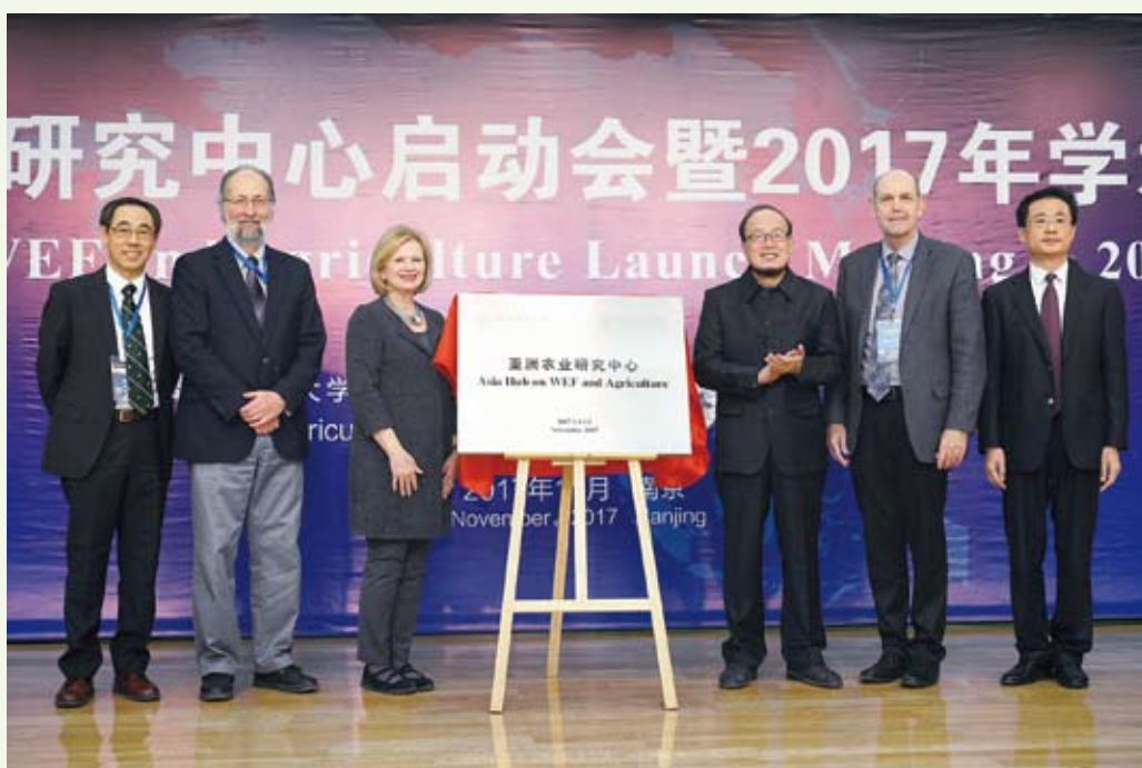
11月，南京农业大学-密歇根州立大学“亚洲农业研究中心”成立，美国密歇根州立大学来访商讨进一步合作事宜