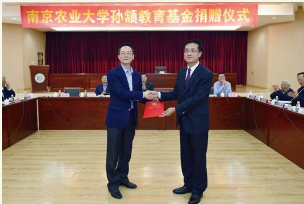
4月15日，南京农业大学孙颉教育基金捐赠仪式在学校举行