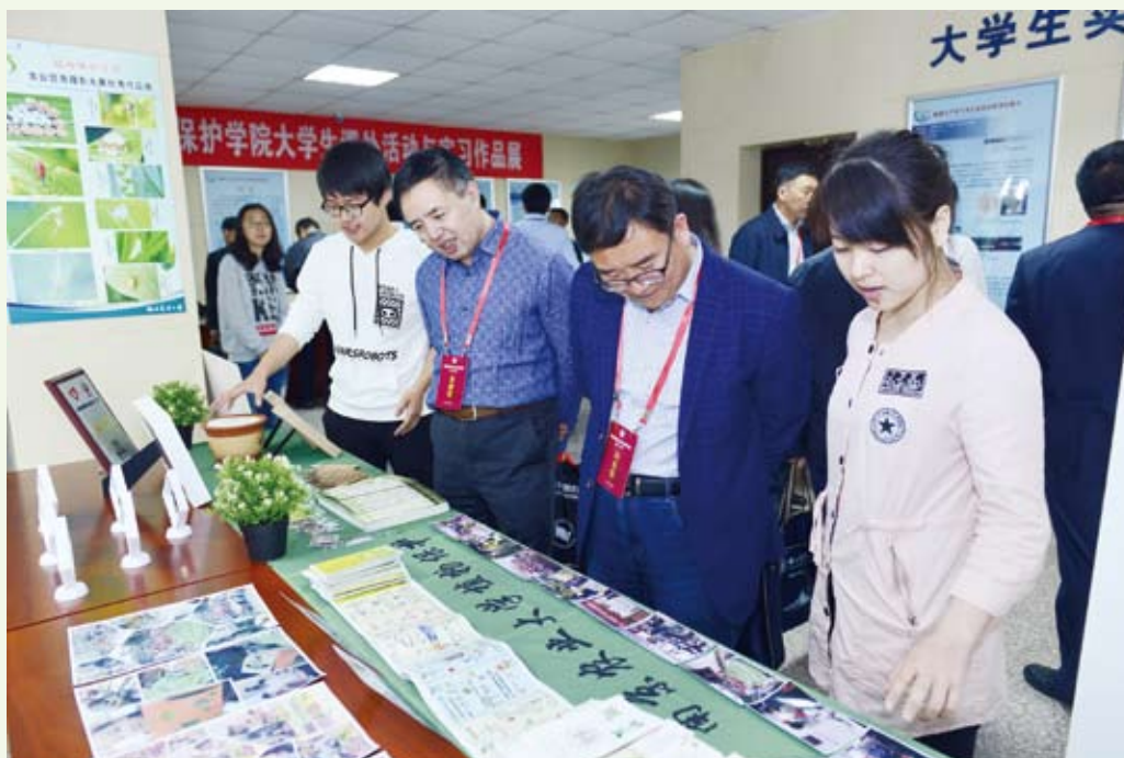
4月25日，农学、植物保护专业率先通过教育部本科专业认证