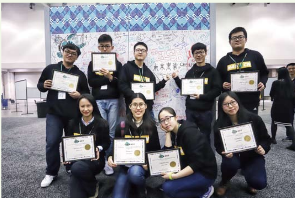
11月14日，在波士顿海因斯国际会展中心举办的2017年国际基因工程机械设计大赛（简称iGEM），学校NAU-CHINA再次斩获金奖