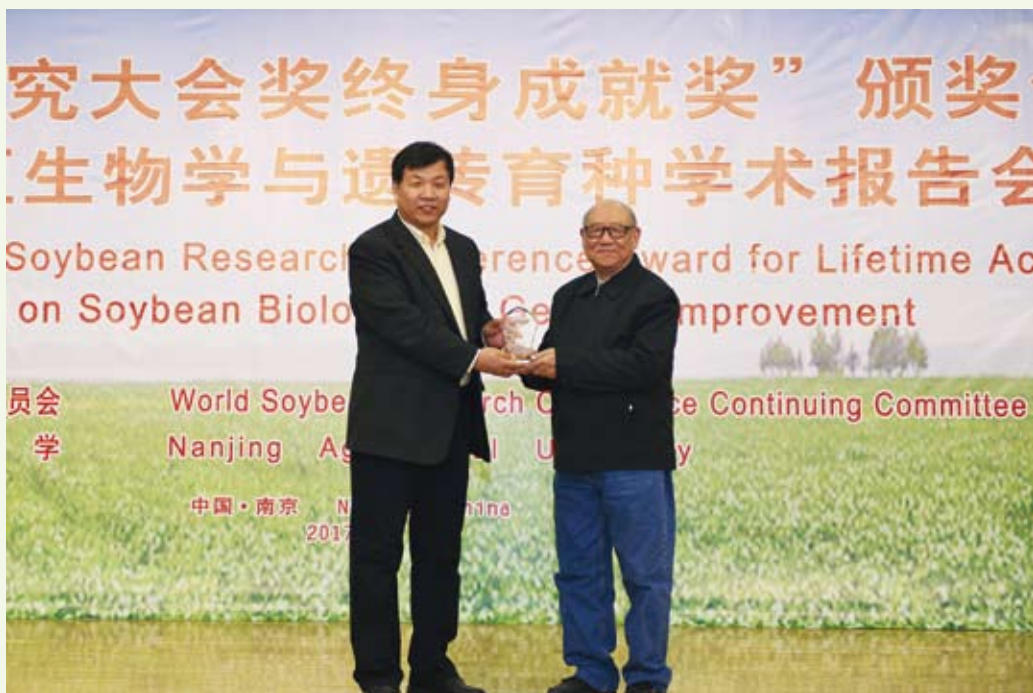
12月6日，第十届世界大豆研究大会奖“终身成就奖”授予盖钧镒院士（右一），以表彰其为世界大豆研究作出的突出贡献