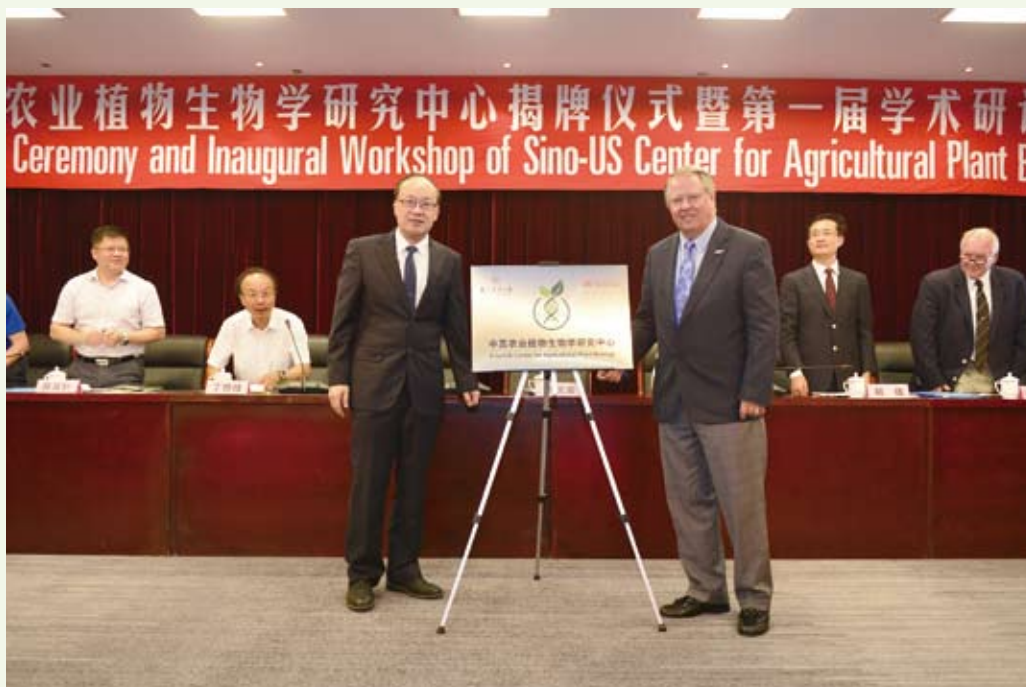
6月11～13日，中美农业植物生物学的研究中心成立