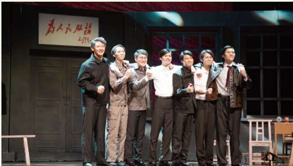
9月25日起，话剧《北大荒七君子》在学校公演，传递南农人世纪家国情怀